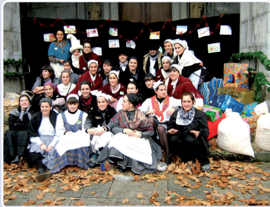
9. Atxutxiamaika, betiko martxan: Iaz 2.000 orduetik gorako aisaldi hezitzaile programa prestatu genuen, 2 eta 12 urte arteko umeei euskaraz bizi eta gozatzeko aukera izan dezaten. Inauteriak, udalekuak, Olentzero ... Eta hau dena behar bezala prestatzeko, 30 hezitzaile baino gehiagok jardun zuten lanean.