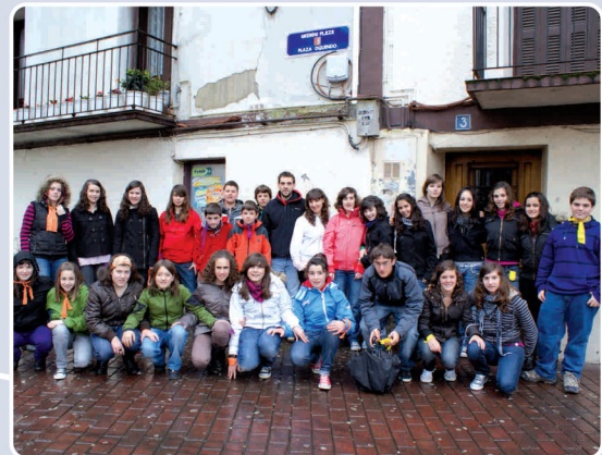
12. Kuadrillategi: Hiru taldetan banatuta, eta zortzi hezitzaile lagun hartuta, 12 eta 16 urte arteko 97 gaztek hartu zuten parte iaz, kuadrillategi proiektuak asteburuetan prestatzen dituen programetan. Helburua badakizue zein den: gazte koadriletan euskaraz berba egiteko ohiturak finkatzea.