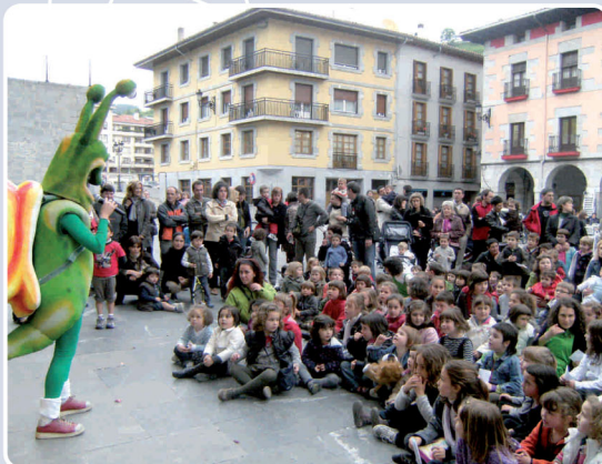
11. Kiribil Plaza Handian: Kiribil, bost hezitzailek lagunduta, hamabi aldiz irten zen, beste horrenbeste ostiraletan, gure herriko txikienekin eta haien gurasoekin jolastera eta kantatzera. Gainera, Madalako parkearen inaugurazioan eta Errosario kaleko jaietan ere egon zen. Kiribilen kamiseta mordo bat ere saldu genuen!