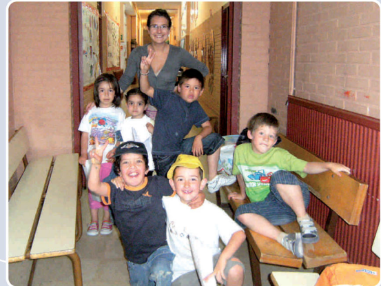
10. Euskara errefortzuak euskaraz soltatzeko: Bost taldetan banatuta, 5 eta 11 urte arteko 34 haurrek jaso zituzten iaz euskara errefortzuak. 5 hezitzailearen eskutik, astean bi orduko saioak izan ziren, eta metodologia ludikoa oinarritzen dira. Erabileran eta motibazioan eragitea da gure erronka nagusia.