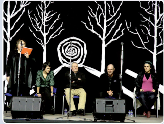
8. Bertsoaren suaren bueltan: Abendua bertsoak berotuta etortzen da gurera. Batetik, Euskal Herriko Bertsolari Txapelketako finalerako sarrerak eta autobus txartelak saldu genituen; eta, bestetik, Gabonetako bertso jaialdian aspaldian ez bezalako jendetza izan genuen: 800 lagun.