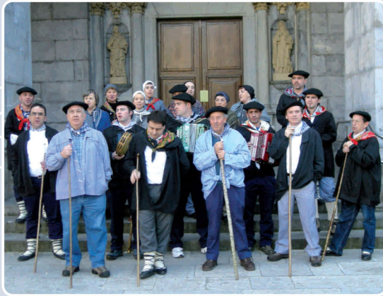
7. Santa Ageda bezperan: Otsailaren 4an zita garrantzitsua izaten dugu tradizioarekin eta gure baserritarrekin. 17. urtea izan zen iazkoa, eta 21 lagun elkartu ginen. Bi taldetan banatu ondoren, 45 baserri inguru koplatu genituen.