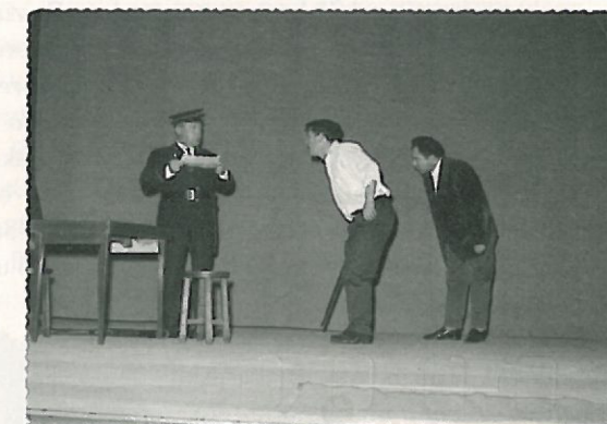
Antzerkia zen Pakoren debilidadeetako bat. Elizako taldea desagertu zenean, bera izan zen Elgoibarko antzerki mundua indartu eta zuzendu zuena.