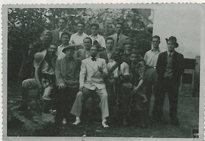
Lagun asko zeukan Pakok, lagun zalea zen. Gainera, bera izaten zen koadrilan saltsa jartzen zuena.