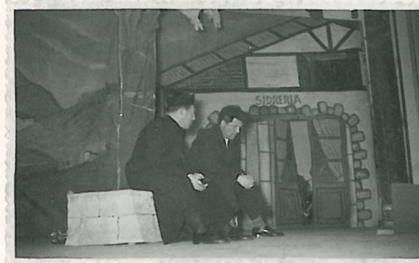
Garai hartan ez zen batere erraza izaten jaialdiak antolatzea (besteak beste, Gobernadore Zibilaren baimena behar izaten zen), baina Pakok beti izaten zituen baimen guztiak eskura.