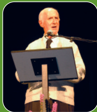
Argizaiola saria 2006

2006ko maiatzean omenaldi beroa egin zizuten Deustun bertan, Euskal Filologia sortu zenuela 30 urte bete zirela eta, eskerak emateko. Fakultate horretan hezi ziren zuri esker Unai Elorriaga, Jon Arretxe eta Joseba Sarrionandia handiak, besteak beste. Baita Andoni Egaña bertsolaria eta Txuma Murugarren abeslaria bera ere. Beste hainbat ere izan gara han ondoren; zu go-goan, eta zuri esker.