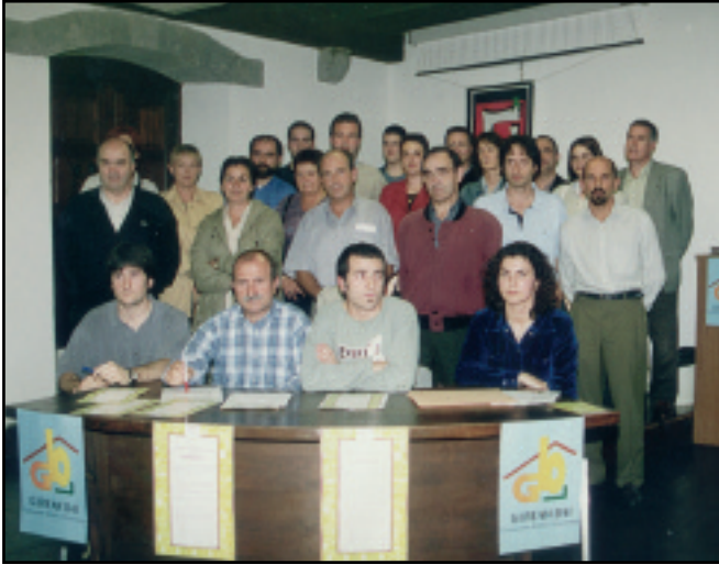
Gurean Bai-Hitzarmena 1996ko urtarrilean aurkeztu genuen. 51 elkarte eta entitatek esan zioten baietz euskara gehiago egiteko konpromisoari.