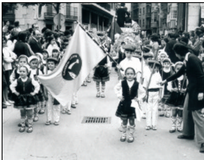
Elgoibarren eta inguruko herrietan ospatzen ziren Euskal Jaietan dantzan egiten zuten. 25 urtez izan zuen Elkarteak bere dantza taldea.