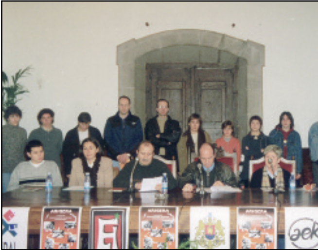
2000. urteko urtarrilean eman genion hasiera Arigera proiektuari. Helburua Elgoibarko helduen euskalduntze-alfabetatzea indartzea zen.