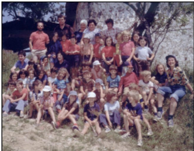
1973an hasi ziren Ikastolako umeak Aubixara igotzen. Helburua, Ikastolatik kanpo ere umeei euskaraz jarduteko aukera eskaintzea zen.