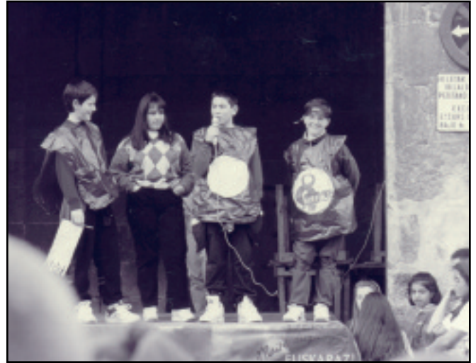
Ume eta gaztetxo asko pasa da Elkarteko bertso-eskolatik, eta batzuek jende aurrean bat batean kantatzeko aukerarik ere izan dute.