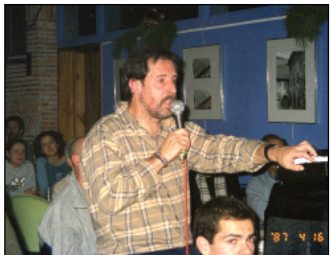
Toletxek taberna bat baino gehiago izan nahi zuen. Kontzertuak eta dia-positiba-emanaldiak izan ziren, batez ere, jarduera garrantzitsuenak.