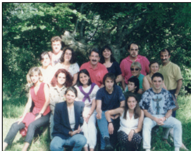
1992ko abenduan ikusi zuen argia elgoiBARREN astekariak. Jende askok parte hartu zuen bigarren etapako lehen proiektuan.