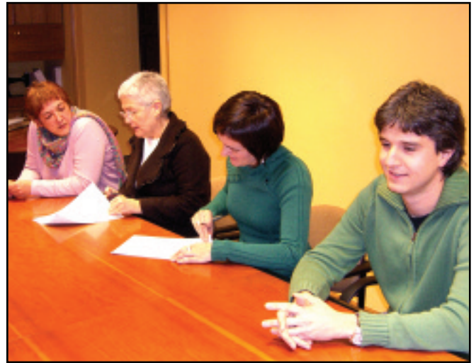
92tik etengabekoa izan da Udalaren eta Elkartearen arteko lankidetzak. Urtero, gainera, hitzarmen ekonomikoa sinatzen dugu bi aldeok.