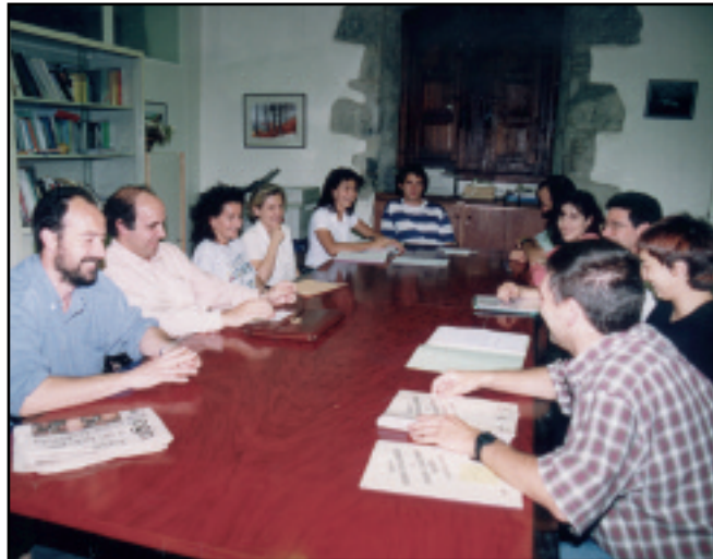
Elgoibarko Izarraren inizatibaz, 1987an jarri zen martxan Udaleko Euskara Batzordea .