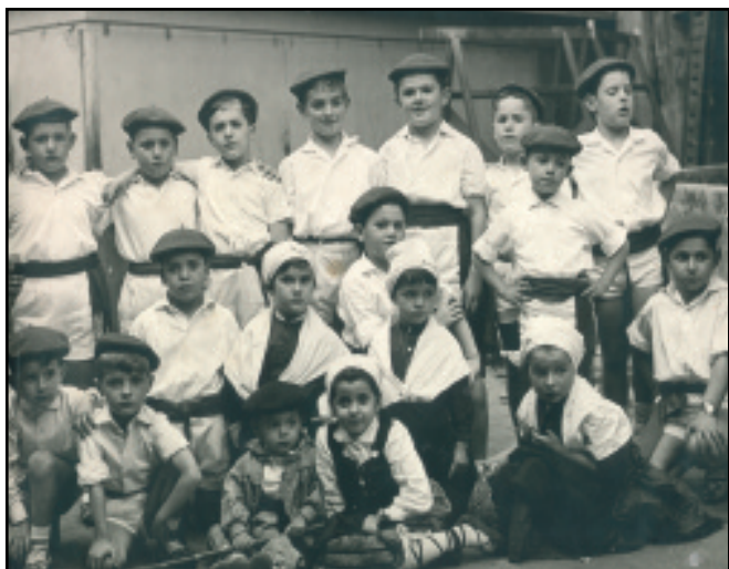
1964an 34 neska-mutilek osatutako estreinako dantza taldea aurkeztu zuten Elgoibarko Izarrak. Aurrerago 400 ikasle izatera ere iritsi ziren.