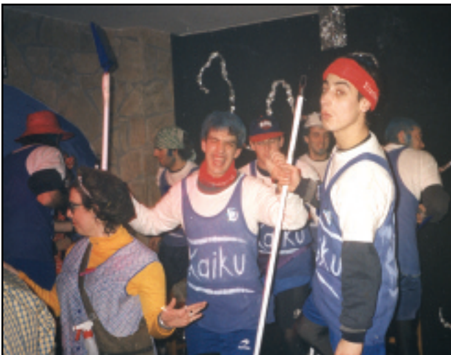
2000ko apirilean zabaldu ziren Toletxe tabernako atek. Ilusio handiarekin prestatutako proiektua izan zen, baina huts egin genuen.