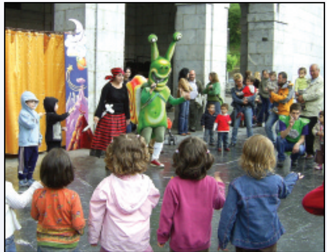
Familetan eragiteko egitasmo honek 16 saio eskaintzen ditu urtean, eta, batzaz beste, 100 ume eta gurasok parte hartzen dute bakoitzean.