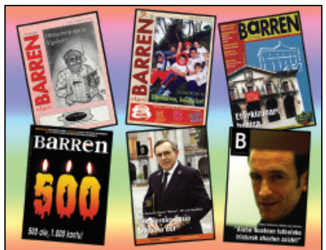
Hasieran txikia zena asko aldatu eta handitu da 15 urteotan; eta, azken aldian, kolorez jantzita sartzen da astero 4.650 etxetan.