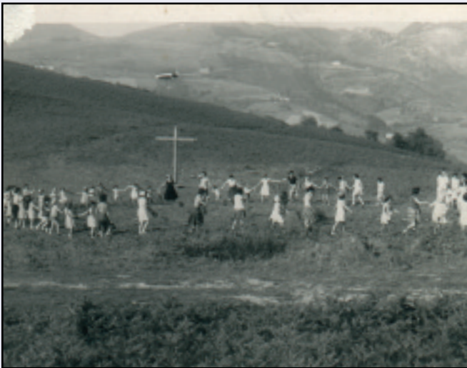
1960an hasi ziren mendi irteerak antolatzen Elgoibarren. "Mendira igotzia askatasunarekin amets egiteko modu bat zan".