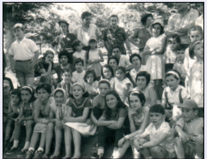
Euskal giroa piztea zen mendi irteeren helburu nagusia, eta kalean egin ezin zena mendian egiten zuten.