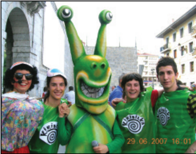
Kiribil eta bere lagunak 2004ko martxoan irten ziren estreinakoz Plaza Handira gure txikienekin jolastu eta kantatzera.