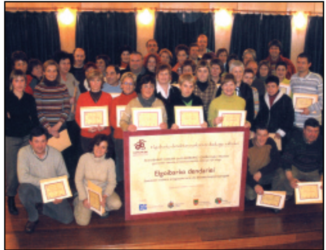
Elkarteen ondoren, 2002ko urtarrilean, 131 merkatarik esan zuten Gurean Bai. 2007an, berriz, 42 ostalarik sinatu zuten hitzarmena.