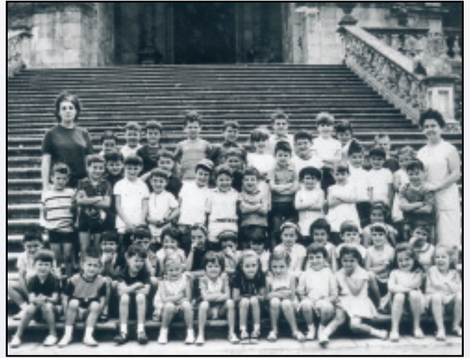
1962ko maiatzean ireki zen Ikastolako lehen gela 29 umerekin, baina 1970ko abendura arte ez zuen baimen ofizialik jaso.