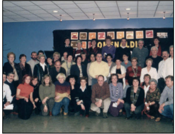
Besteak beste, gure esker ona eta errekonozimendua azaldu genien euskara ikasten jardun duten herritarrei.