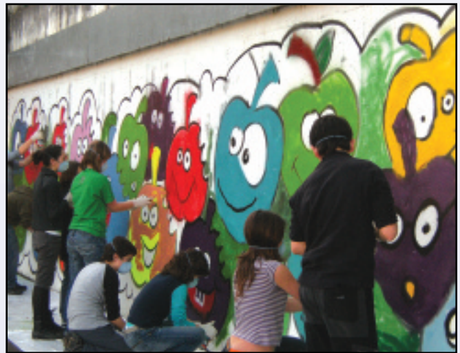
2007an bi koadrilatako 24 gaztetxok parte hartu bazuten, bigarren urtean 5 koadrilatako 79 gaztetxok eman dute izena Kuadrillategin.