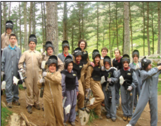
12 eta 14 urteko gaztetxoek koadriletan euskaraz egiteko ohitura indartu nahi duen proiektua aurkeztu genuen 2006ko urrian: Kuadrillategi .