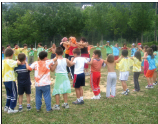
Makina bat ume pasa da harrez gero Aubixatik. Ikastolako umeak bakarrik hasieran, eta ikastetxe guztietakoak nahasian gerora.