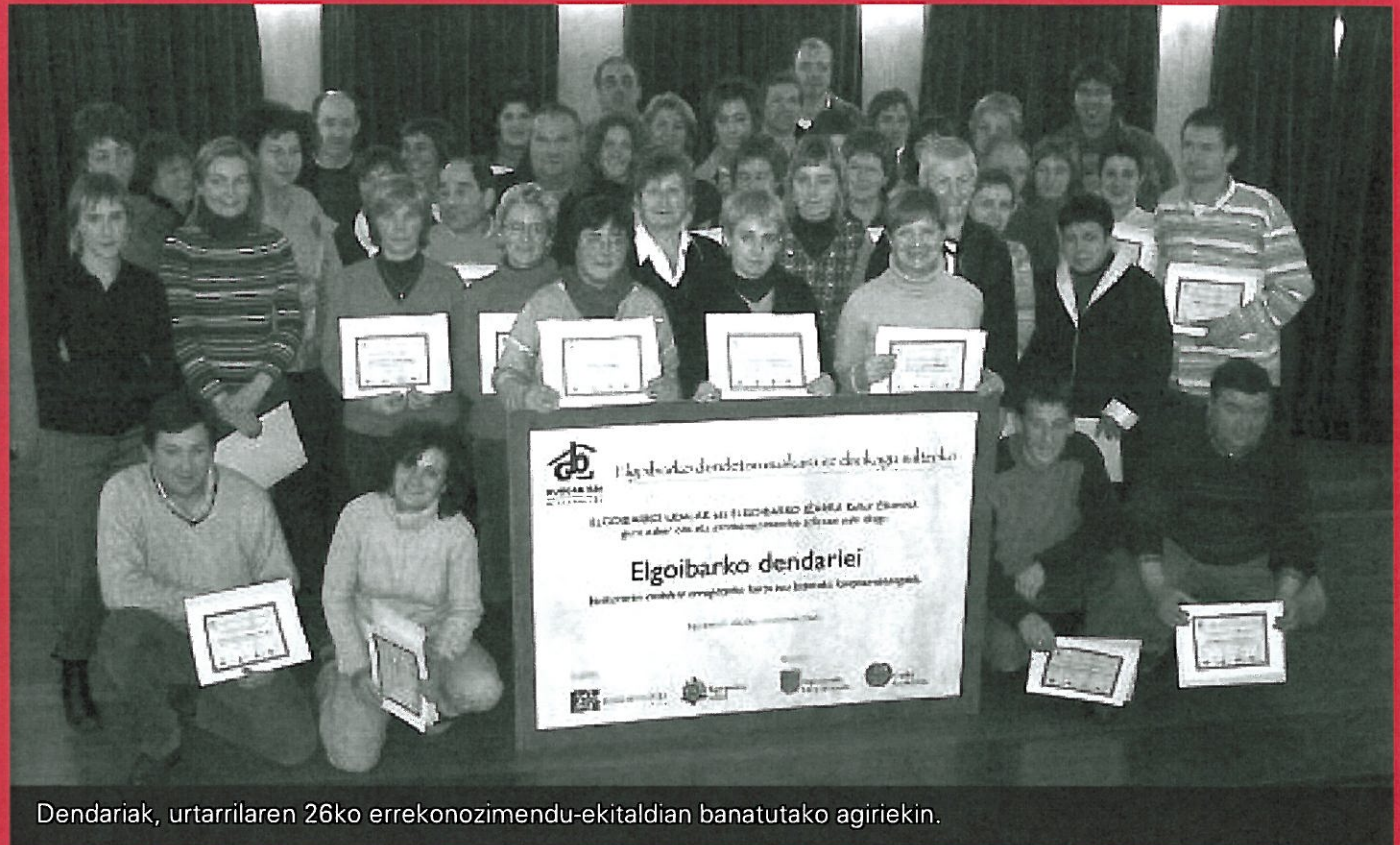
Dendariak, urtarrilaren 26ko errekonozimendu-ekitaldian banatutako agiriekin.