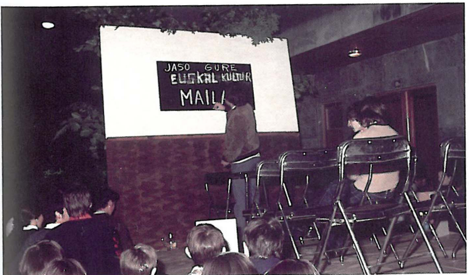
Euskaraz antolatzen ziren kultur jarduerak izaten zuten erantzun eskasaren salaketa.