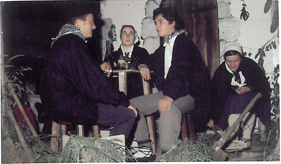
Baserria eta gure herria uztarri berean daudela erakutsi nahi zuten 1975eko karrozarekin.